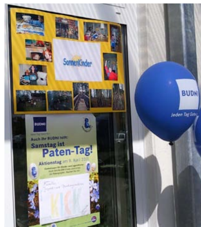
Patenschaft von BUDNI

Das Gruppenangebot „ Sonnenkinder “ für Grundschüler und Grundschülerinnen entwickelt sich für die Kinder weiterhin positiv. Die Gruppenstärke von acht Kindern ist immer erreicht. Ein bedarfsgerechtes Angebot wurde geschaffen. Die Drogeriefiliale Budnikowski (BUDNI) am Ilmenaucenter hat die Patenschaft für die Gruppe übernommen. Zwei großzügige Spenden konnten für Neuanschaffungen verwendet werden. Für die Zukunft ist ein kontinuierlicher Fahrdienst geplant.