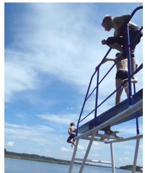
Ferienfahrt an den Schaalsee